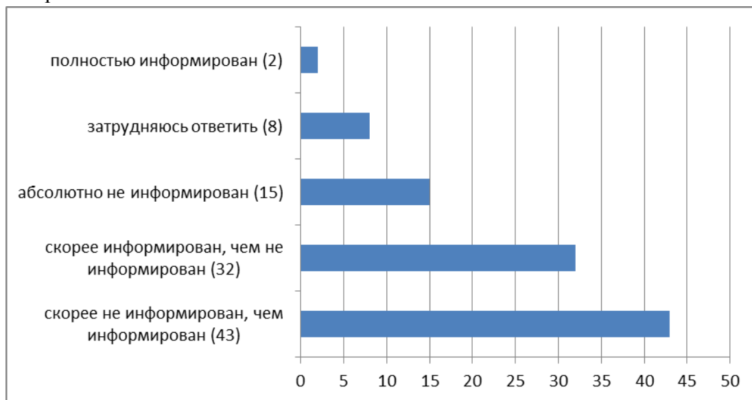
Рисунок 3. Распределение ответов респондентов на вопрос о степени информированности населения о деятельности органов местного самоуправления, %

получить информацию, при том что разновидность источников получения таковой неизменно возрастает.