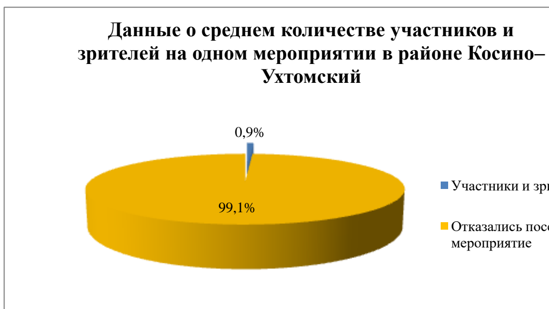
Рис. 1 Данные о среднем количестве участников и зрителей на одном мероприятии в районе Косино-Ухтомский

3) «Назовите причины отказа участвовать или быть зрителем проводимых мероприятий?» Основной причиной отказа является отсутствие мотивации к посещению мероприятий. По утверждению опрошиваемых, проводимые мероприятия не вызывают у них должного интереса. Таким образом, данный социологический опрос жителей района подтверждает приведенные в первом этапе исследования причины низкой посещаемости мероприятий.