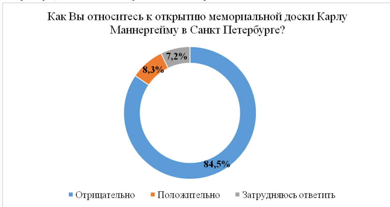
Диаграмма 1. Выявление отношения граждан к открытию мемориальной памятной доски Карлу Маннергейму

После того, как в Санкт-Петербурге установили памятную доску Маннергейму в электронном журнале LiveJournal, был проведен опрос общественного мнения 3 (см. диаграмму 1). В исследовании участвовали 556 респондентов – посетители сайта LiveJournal.