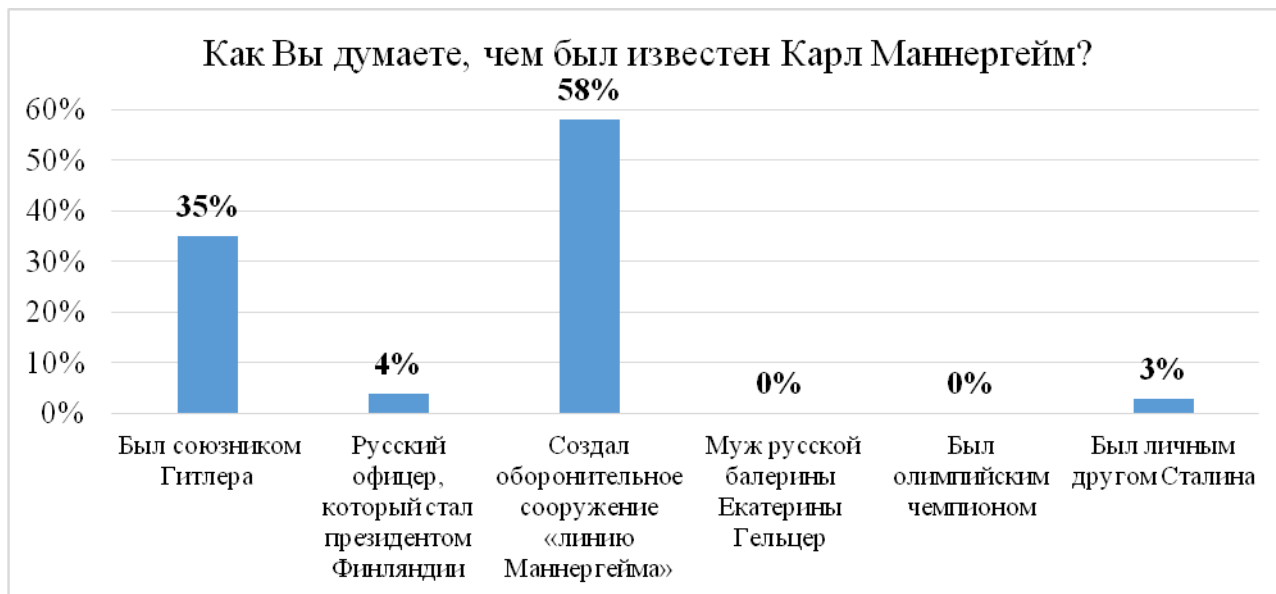
Диаграмма 3. Факты, по которым Маннергейм известен респондентам

Большей части респондентов личность Карла Маннергейма оказалась известной и для того чтобы понять «чем же он им запомнился», авторы статьи проанализировали результаты ответы на второй вопрос (см. диаграмму 3).