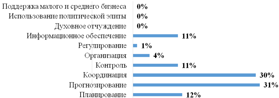
Диаграмма 5. Механизмы государственного управления, применяемые Карлом Маннергеймом

Прогнозирование, по мнению 31 % респондентов, является самым важным механизмом управления. Авторы статьи не могут не согласиться со значимостью прогнозирования, как процесса оценки возможных путей развития, последствий тех или иных решений. Однако сложно рассматривать отдельно каждый из указанных механизмов, так как в управлении они применяются комплексно. Они зависят друг от друга. Несмотря на то, что планирование включается в процесс прогнозирования, оно заняло лишь третье место с результатом 12 %. А на второй позиции расположилась координация 30 % – авторы статьи считают, что такая расстановка приоритетов вызвана прямой аналогией между механизмами управления и военно-политической деятельностью Маннергейма. 11 % выборов получили информационное обеспечение и контроль. Информация всегда играла важную роль в жизни человека, а в политической сфере она чрезвычайно значима, особенно когда это дополняется хорошими каналами коммуникации. Карл Маннергейм любил наблюдать за поведением (состоянием) не только управляемой им системы – государством, с целью принятия оптимизирующих управленческих решений, но и за дикими животными. В.А. Потиевский в романе сравнивал Карла Маннергейма с хищным тигром, который опираясь на свои внутренние инстинкты выжидает время, сидя в засаде, продумывает план действий, а потом внезапно и стремительно достигает цели.