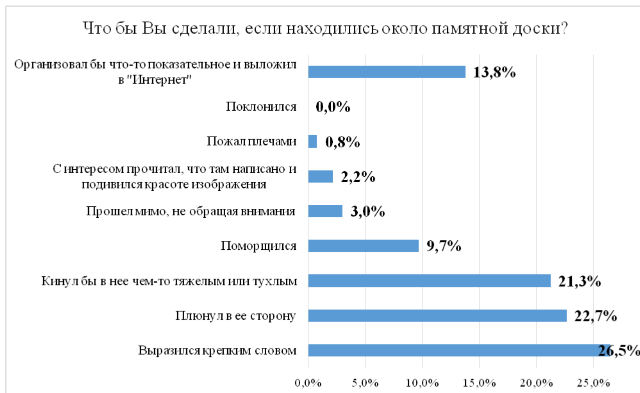
Диаграмма 2. Выявление отношения граждан к открытию мемориальной памятной доски Карлу Маннергейму

Как видно на данной диаграмме 2, отношение респондентов разделилось на три категории: безразличие, ненависть и «показушность». 340 респондентов в той или иной форме проходя мимо памятной доски Маннергейму, выразили бы свое негативное отношение, из них 50 – намерены запечатлеть и продемонстрировать в Интернете общественности свое неуважение. 14 респондентов не проявили бы интереса, что тоже не является хорошим показателем. При этом 8 респондентов относятся к бюсту «Кавалергард Маннергейм» как к объекту культуры – авторы статьи предполагают, что это является самой верной гражданской позицией в сложившейся ситуации.