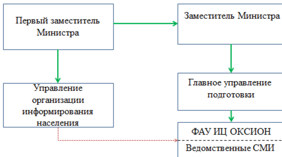
Рисунок 1 – Система управления ведомственными СМИ МЧС России.

Из Рисунка 1 мы видим, что ведомственные СМИ структурно находятся в ФАУ «Информационный центр общероссийской комплексной системы информирования и оповещения населения в местах массового пребывания людей». В связи с чем, в системе управления имеется проблема дублирования – субъектами управления одновременно являются Управление организации информирования населения и Главное управление подготовки, вследствие чего возникают проблемы размывания ответственности за конечный результат, низкой координации и несогласованности в редакционно-издательской политике и в конечном итоге снижение качества информационного продукта.