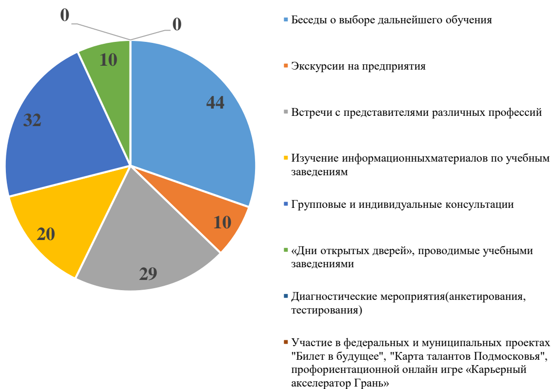
Рис. 3 – Ответы кадет на 3-й вопрос анкеты «Какие мероприятия проводятся в рамках профессиональной ориентации с кадетами?»

Исходя из ответов респондентов, представленных на рисунках 2 и 3, на вопросы, касающиеся профессиональной ориентации, можно сделать вывод, что профессиональная ориентация с кадетами проводится не в полном объеме и имеет военно-профессиональную направленность.