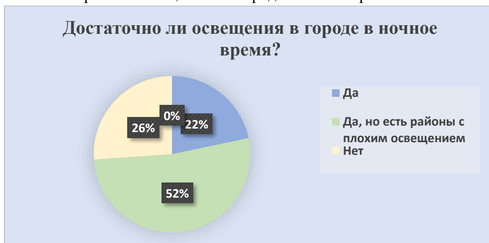
Рис. 8 – Данные о наличии достаточного ночного освещения в городе

Из содержания рисунка 8 видно, что 52 % опрошенных считают количество наружного освещения в городе достаточным, однако это наблюдается не во всех районах города. Не стоит упускать из вида показатель недостаточного освещения в Волгограде, так как его выбрали 26 % респондентов. Данные позволяют судить о выполнении программы в неполном объеме.