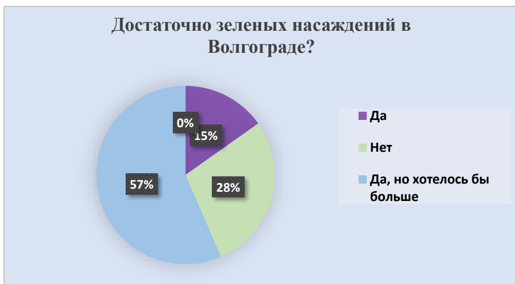
Рис. 2 – Данные об уровне озеленения территорий в городе, по мнению жителей Волгограда

I блок – Уровень озеленения территории города Волгограда