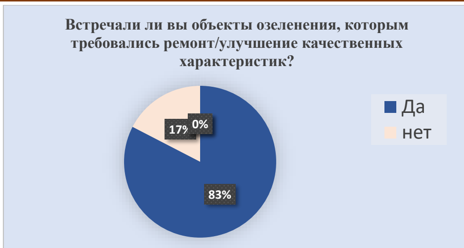
Рис. 3 – Данные о состоянии благоустройства на объектах озеленения

По полученным данным рисунка 3 нам известно, что 83 % жителей города встречали объекты озеленения такие, как скверы, сады, бульвары, парки, которым требовались либо капитальный ремонт, либо частичное восстановление качественных характеристик. Ненадлежащее состояние благоустройства на объектах озеленения не способны предоставить комфортную, эстетически выразительную среду города и выполнить рекреационные и санитарно-защитные функции для жителей Волгограда.