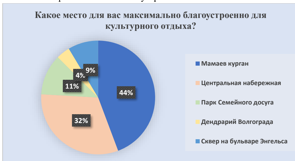
Рис. 6 – Данные о наиболее популярных местах общего пользования

По рисунку 5 мы видим, что отношение граждан к прогулкам в парках, скверах, бульварах, негативное. 91 % респондентов практически не посещают места отдыха с достаточным озеленением, соответственно с чистым воздухом и разрядной обстановкой. Это связано с низким уровнем благоустройства этих мест (расположенных рядом с домом): разбитые дорожки, деревья не приведены в порядок, грязные фонтаны, скучная и несовременная материальная составляющая парков – эти факторы и могут повлиять на негативное/нейтральное отношение граждан к прогулкам в экологически чистых местах. Органы исполнительной власти отдают предпочтение более посещаемым местам города и направляют все силы и финансы на их благоустройство.