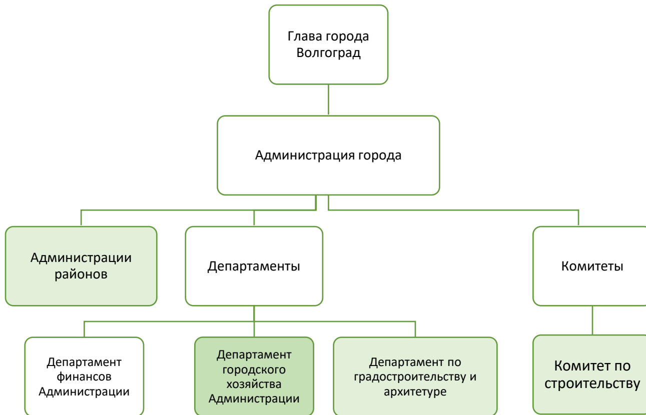
Рис. 1 – Структура государственных органов, задействованных в реализации программы «Благоустройство Волгограда» [3]

Непосредственное управление муниципальными программами, включая и программу «Благоустройство Волгограда» осуществляет администрация города и ее департаменты. Ниже приведена структура администрации с её подчиненными подразделениями (см. Рис. 1).