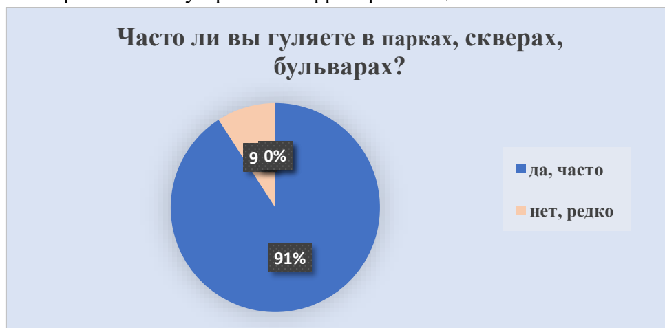
Рис. 5 – Данные об отношении граждан к территориям общего пользования

II блок – Уровень благоустройства территорий общего пользования.