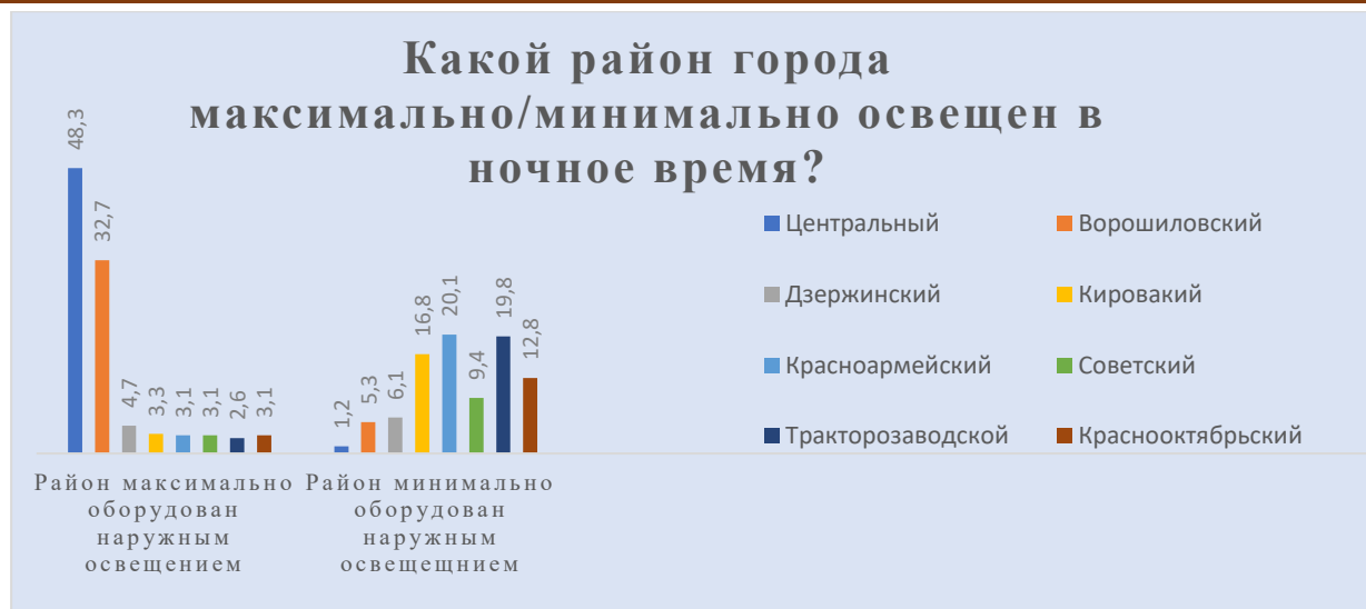
Рис. 9 – Данные о наличии достаточного наружного освещения в районах города Волгограда, данные отражены в процентах от общего числа респондентов

По данным рисунка 9 видно, что наиболее освещёнными районами города являются Центральный район (48,3%) и Ворошиловский район (32,7%). Такие результаты могут говорить о том, что исполнительная власть уделяет больше внимания районам наиболее развитым и перспективным.